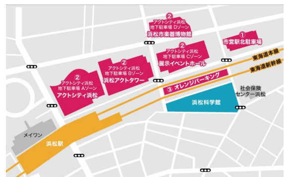
最寄りの一般駐車場

決勝大会来場の皆様は正面入口から入り、科学館の受付を通らずそのまま奥の受付までお進みください。