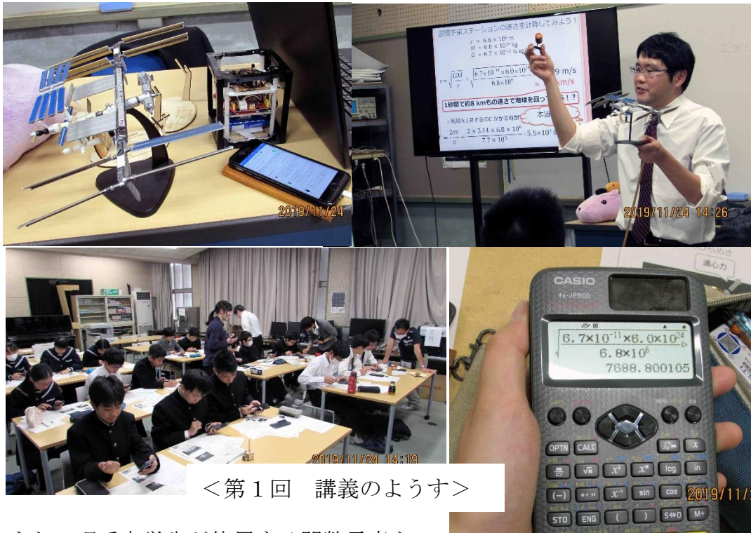
<第1回 講義のようす>

講座では、「物理学」を使って人工衛星について迫っていきます。まずは、物質や運動の基本的な性質を学んでいき、人工衛星はどのくらいの高さを回っているのか？人工衛星はなぜ落ちてこないのだろうか？飛行機と違って「飛んでいる」ようには見えないのは、なぜだろう？などの疑問を身近な道具を使って実験し、万有引力と遠心力について考え、理解を深めていきました。