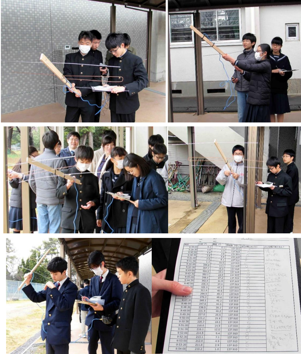
<自作アンテナを使って人工衛星電波受信実験の様子>

受信は、3人1組でチームをつくり、1人はアンテナを動かすアンテナ係、1人が受信機の周波数を調整する受信機係、もう1人が記録係として、時計を見ながら、方位、高度、周波数を読み上げ、受信の有無を記録していきます。受信機の音は全員で聞きます。