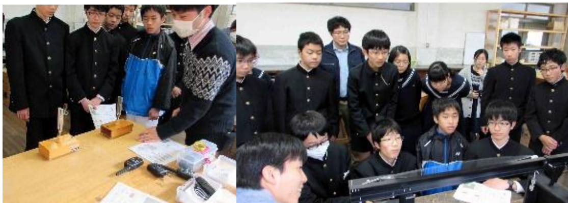
<共振現象・固有振動数について学ぶ>

はじめに座学で、波が強め合い大きく振動する性質・固有振動数など学びました。その後、製作するアンテナの長さを求めていきます。