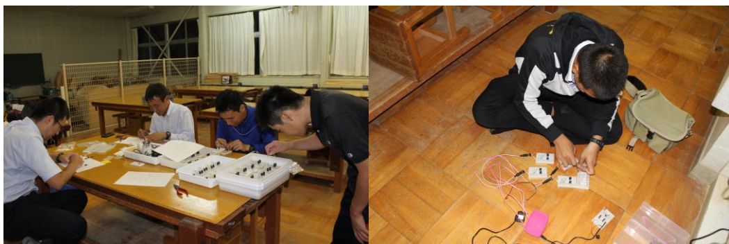
図3 制御回路製作様子