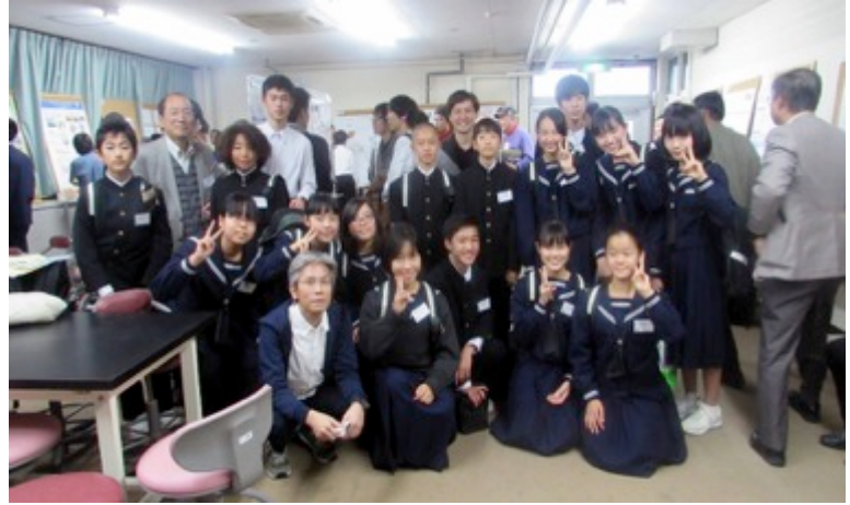
<会に参加した受講生と記念写真>

今回、この会に参加させていただいたことにより、私たちのように研究を行っている中高生が、大人の方々のお話を聞くことが出来ました。そのため「自分たちの研究をこの方々ように進めていけばうまくいくかもしれない」といったように新たな視点を得たり、自分自身が発表することで改めて自分たちの不十分な部分に気づくことができました。この会によって、発表者同士互いに影響を与えたのではないのでしょうか。